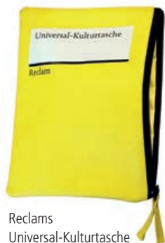
Reclams Universal-Kulturtasche ISBN 978-3-15-900150-0 UVP € 10,00