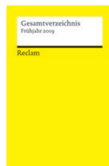
Gesamtkatalog Frühjahr 2019 ISBN 978-3-15-089001-1 Erscheint im Februar