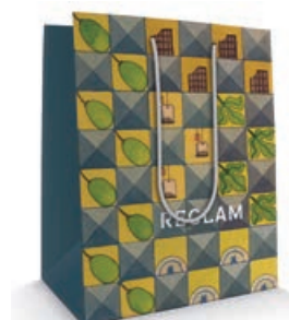
»Kulinaria« Tragetasche (einzeln) ISBN 978-3-15-089014-1