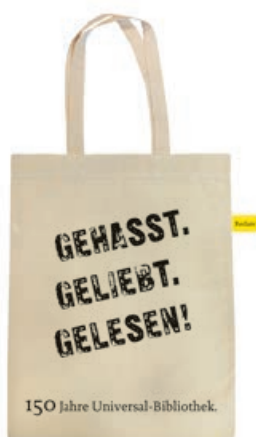
150 Jahre Universal-Bibliothek Baumwollbeutel. VE 10 Stück ISBN 978-3-15-92005-3 · € 10,00