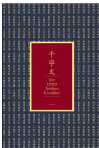
Der 1000-Zeichen-Klassiker A2-Plakat · ISBN 978-3-15-089042-4