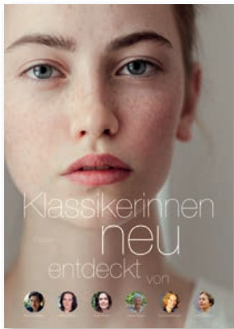
»Klassikerinnen neu vorgestellt« A2-Plakat · ISBN 978-3-15-089047-9 Erscheint im Mai