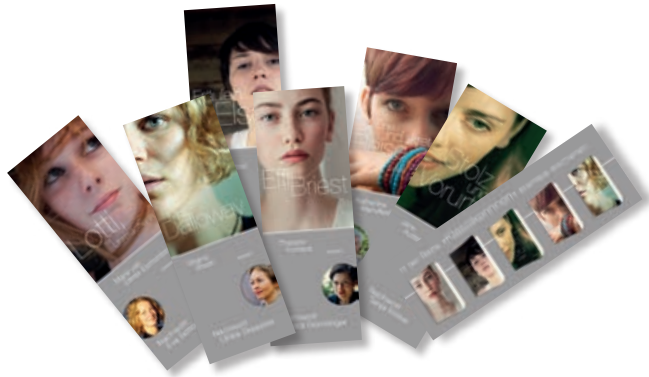
»Klassikerinnen neu vorgestellt« 6 Lesezeichen in je 5 Ex. VE 30 St. · ISBN 978-3-15-089048-6 Erscheint im Mai