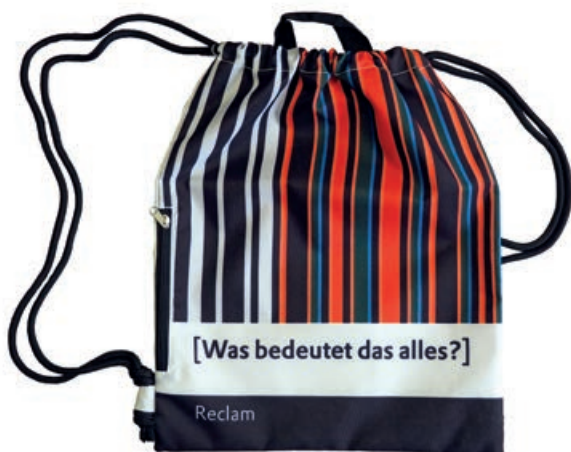
Reclams Denksportbeutel ISBN 978-3-15-95001-2 UVP € 14,- Erscheint im Februar