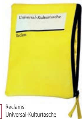
Reclams Universal-Kulturtasche ISBN 978-3-15-900150-0 UVP € 10,00