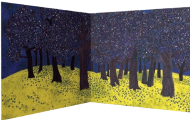
Deko-Aufsteller »Die schönsten Lieder« Format: 21 x 68 cm ISBN 978-3-15-089085-1