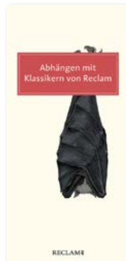
Streifenplakat »Abhängen mit Klassikern« ISBN 978-3-15-089088-2 Ab 13. Mai