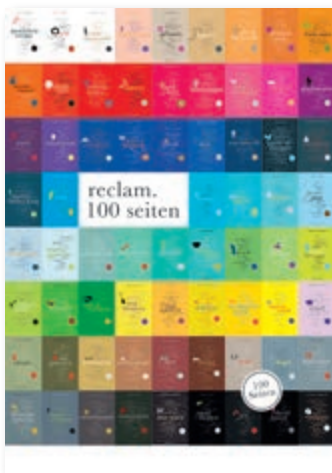
A2-Plakat »Reclam. 100 Seiten« ISBN 978-3-15-089093-6 Ab 12. Februar