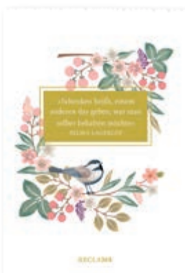
Papiertüten »Frühling 2020« VE 500 St. · € 18,00 ISBN 978-3-15-092103-6 Ab 11. März