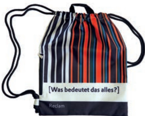
Reclams Denksportbeutel ISBN 978-3-15-095001-2 UVP € 14,-