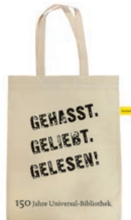
150 Jahre Universal-Bibliothek Baumwollbeutel. VE 10 Stück ISBN 978-3-15-92005-3 · € 10,00