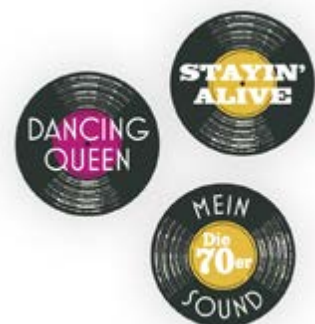
»70er-Buttons« Give away im Set (3x2) ISBN 978-3-15-089091-2 Ab 12. Februar