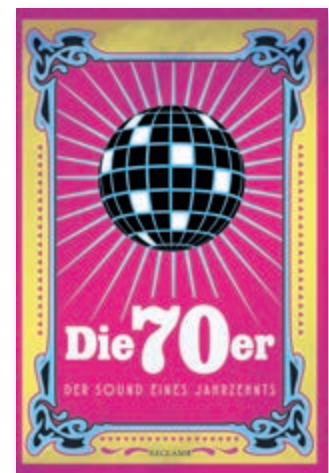
A2-Plakat »Die 70er« ISBN 978-3-15-089090-5 Ab 12. Februar