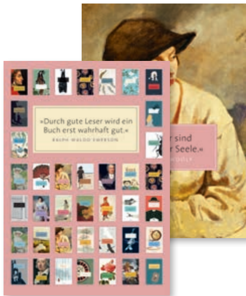
A1-Wendeplakat »Klassiker im Taschenbuch« ISBN 978-3-15-089113-1