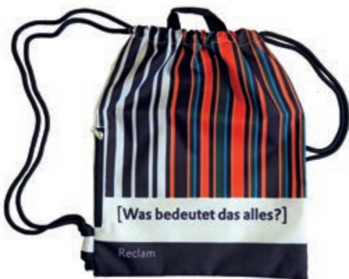
Reclams Denksportbeutel ISBN 978-3-15-095001-2 UVP € 14,-