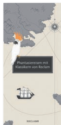
Streifenplakat »Phantasieren mit Klassikern« ISBN 978-3-15-089103-2