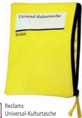
Reclams Universal-Kulturtasche ISBN 978-3-15-900150-0 UVP € 10,00