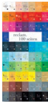
Prospekt (VE 25 St.) »Reclam. 100 Seiten« ISBN 978-3-15-089050-9