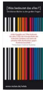
Prospekt (VE 25 St.) »Was bedeutet das alles?« ISBN 978-3-15-089087-5