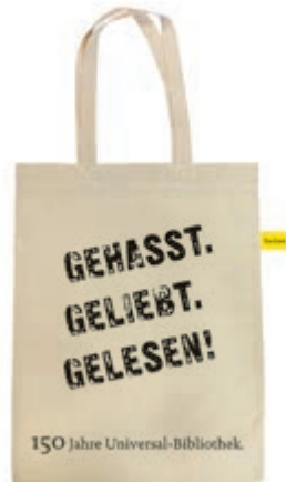
150 Jahre Universal-Bibliothek Baumwollbeutel. VE 10 Stück ISBN 978-3-15-92005-3 · € 10,00