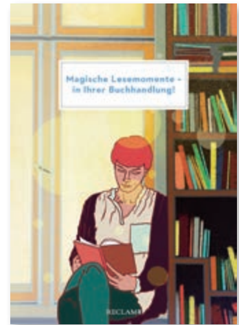
A1-Plakat »Magie des Lesens« ISBN 978-3-15-089115-5