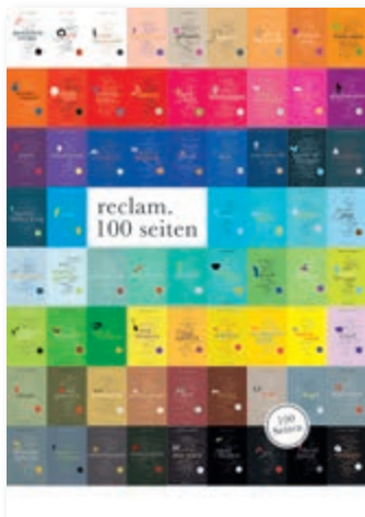
A2-Plakat »Reclam. 100 Seiten« ISBN 978-3-15-089093-6