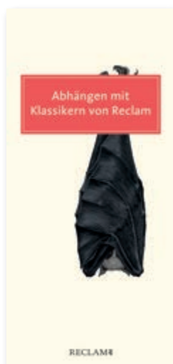
Streifenplakat »Abhängen mit Klassikern« ISBN 978-3-15-089088-2