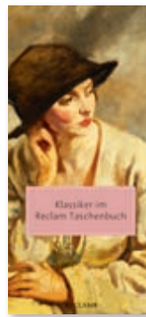
Prospekt (VE 25 St.) »Klassiker im Taschenbuch« ISBN 978-3-15-089114-8