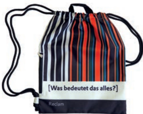
Reclams Denksportbeutel ISBN 978-3-15-095001-2 UVP € 14,-