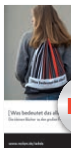
Sonderprospekt »Was bedeutet das alles?« ISBN 978-3-15-089087-5 Erscheint am 17. Juli