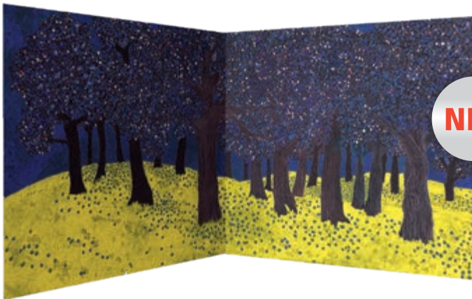
Deko-Aufsteller »Die schönsten Lieder« Format: ca. A3 ISBN 978-3-15-089085-1 Erscheint am 25. September