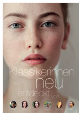
A2-Plakat »Klassikerinnen neu entdeckt« ISBN 978-3-15-089047-9