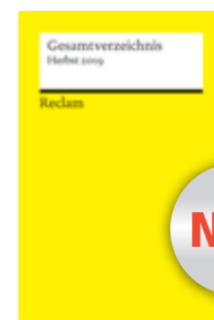
Gesamtkatalog Herbst 2019 ISBN 978-3-15-089002-8 (ab August 2019)