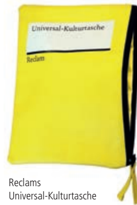
Reclams Universal-Kulturtasche ISBN 978-3-15-900150-0 UVP € 10,00