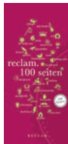
Sonderprospekt »Reclam. 100 Seiten« ISBN 978-3-15-089050-9