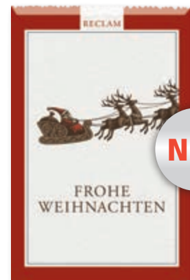
Papiertüten »Frohe Weihnachten« VE 500 St. · € 18,00 ISBN 978-3-15-092085-5 Erscheint am 25. September