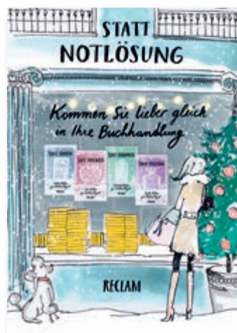
A2-Plakat »Statt Notlösung« ISBN 978-3-15-089046-2