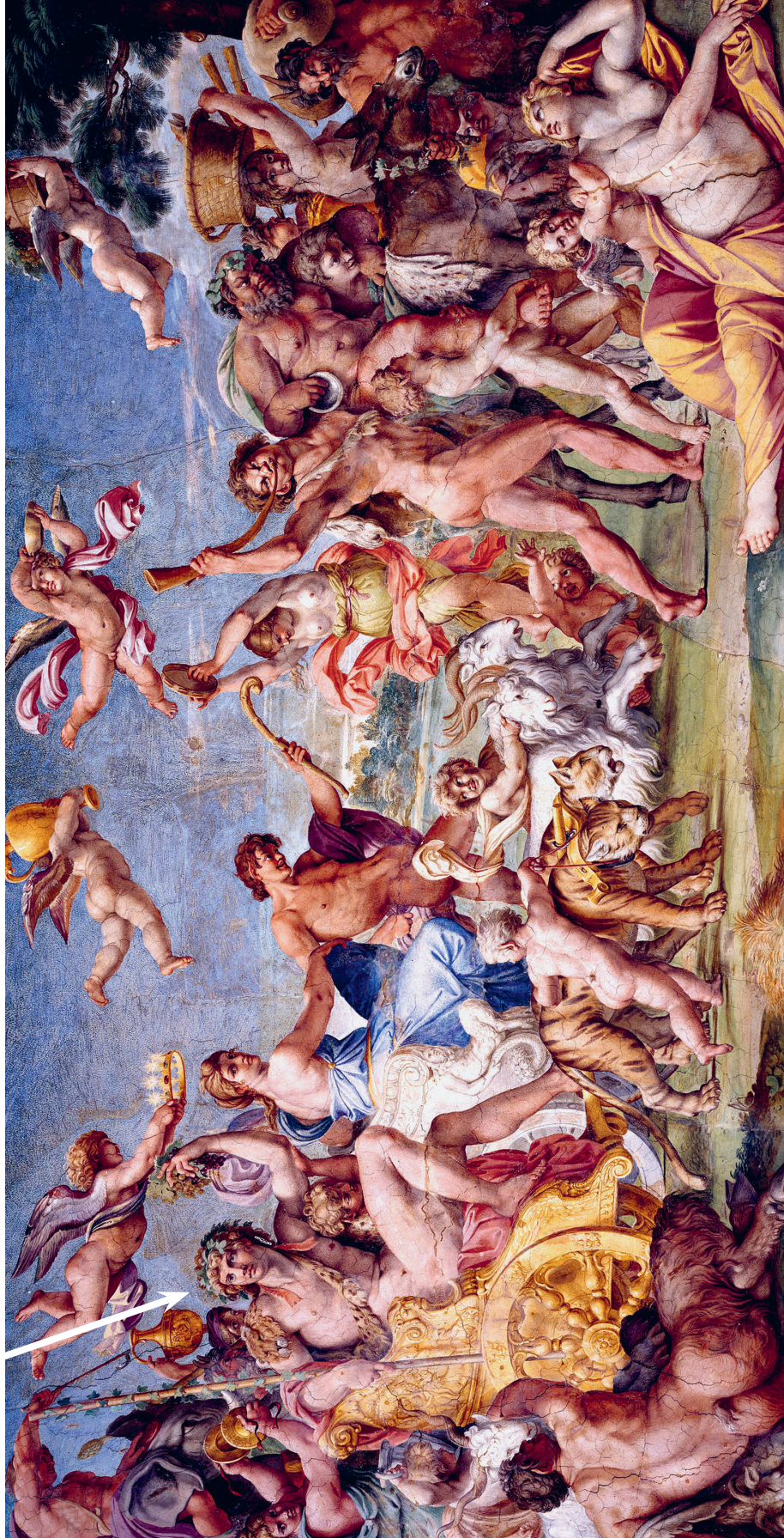
Annibale Carracci: Der Triumph von Bacchus und Ariadne , ca. 1597–1600, Palazzo Farnese in Rom.