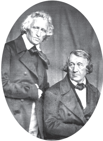
Jacob und Wilhelm Grimm, 1847