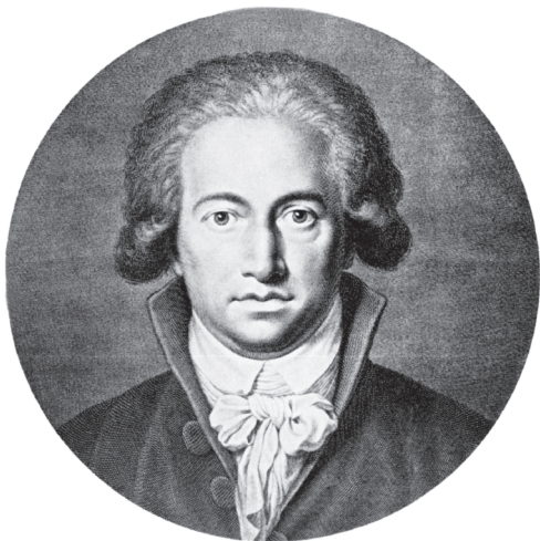
Johann Wolfgang Goethe